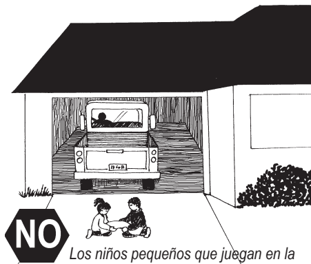
Los niños pequeños que juegan en la entrada del garaje corren peligro de un vehículo que de marcha atrás.

Asegúrese que los niños se vistan en ropa con reflectores cuando caminan por la noche y en la madrugada. Los peatones son muy difíciles de distinguir en la oscuridad.